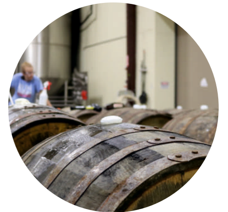
ПРИ ПРОИЗВОДСТВЕ ВИНА (ВЫДЕРЖКА В БОЧКАХ В ПОГРЕБАХ), ОСОБЕННО ПРИ ИСПОЛЬЗОВАНИИ СИСТЕМЫ ТУМАНООБРАЗОВАНИЯ (ДЛЯ УДАЛЕНИЯ КОНДЕНСАТА)