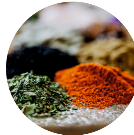
ПРОИЗВОДСТВО И УПАКОВКА СПЕЦИЙ (ПРИ ДЕЗИНФЕКЦИИ КОНВЕЙЕРНЫЙ ЛЕНТ)