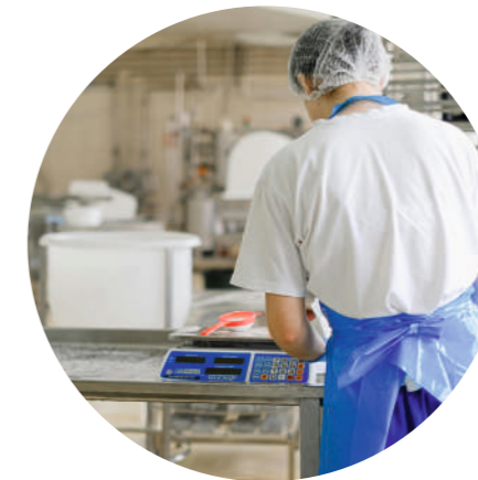
ПРОИЗВОДСТВО / УПАКОВКА СУХИХ ЗООКОРМОВ (ПРИ УБОРКЕ РАБОЧИХ ПОВЕРХНОСТЕЙ)