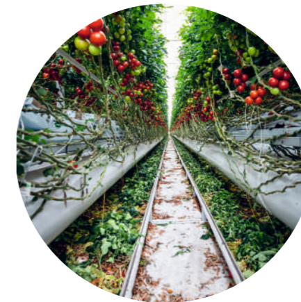
ТЕПЛИЦЫ И ОРАНЖЕРЕИ ДЛЯ ВЫРАЩИВАНИЯ ОВОЩЕЙ И ФРУКТОВ (ПРИ ОБРАБОТКЕ ИНВЕНТАРЯ)