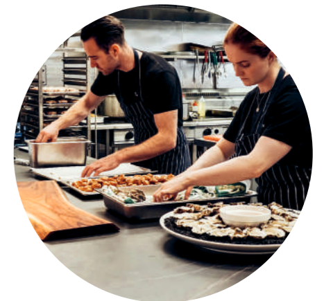
ФАБРИКИ-КУХНИ (ПРИ ОБРАБОТКЕ ПРОИЗВОДСТВЕННОГО ИНВЕНТАРЯ, РАЗДЕЛОЧНЫХ ДОСОК)